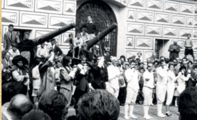
Patrně první vystoupení skupiny Mušketýři & Bandité na nádvoří pražského Vojenského muzea v létě 1960

století na rakousko-uherské vojenské akademii podle metodiky italského mistra Barbasettiho (tato škola se učila ještě ve 20. letech minulého století ve vojenské akademii