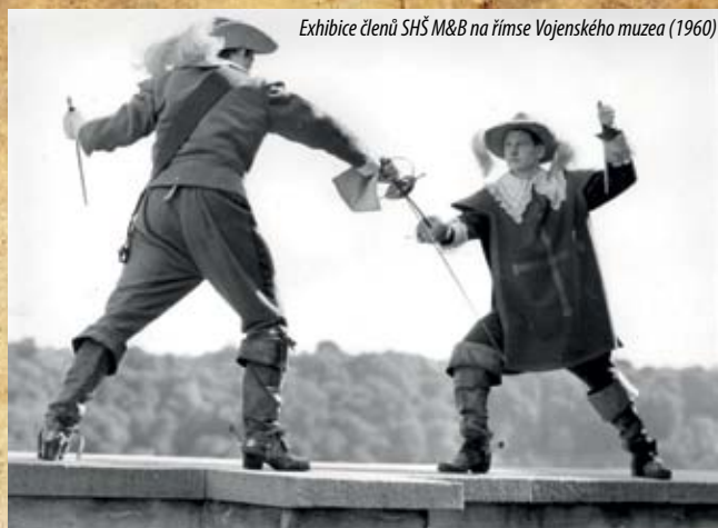
Exhibice členů SHŠ M&B na římsě Vojenského muzea (1960)

šermuji v šermířském oddíle TJ. Baník pod dohledem mistra třikrát týdně.