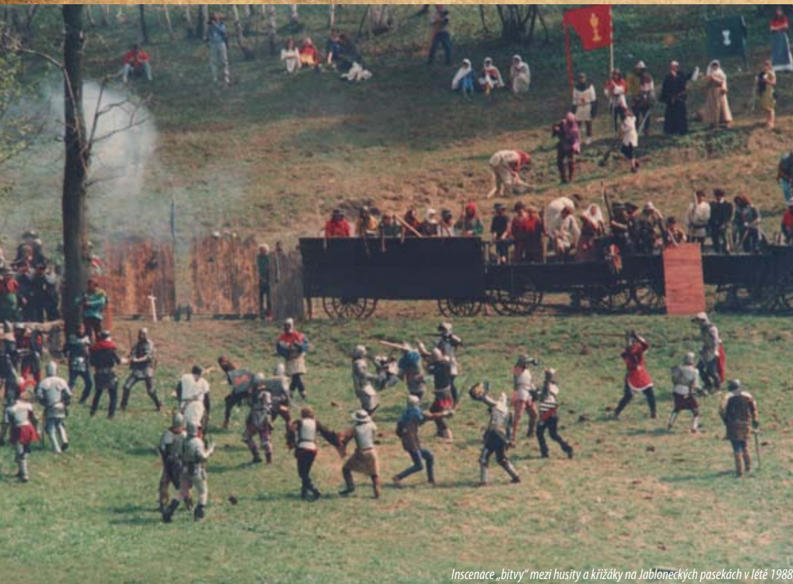
Inscenace „bitvy“ mezi husity a křižáky na Jabloneckých pasekách v létě 1988