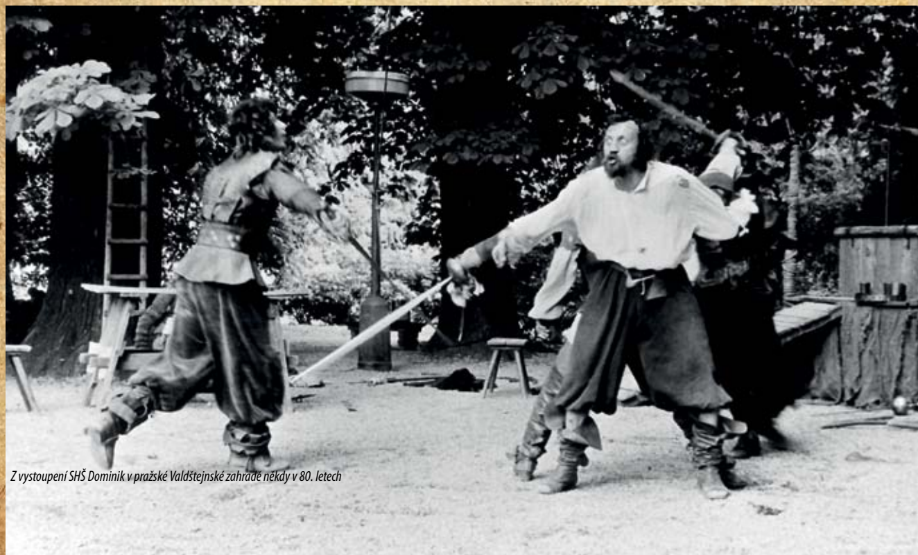
Z vystoupení SHŠ Dominik v pražské Valdštejnské zahradě někdy v 80. letech