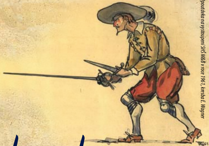
Upoutávka na vystoupení SHŠ M&B v roce 1961, kresba E. Wagner