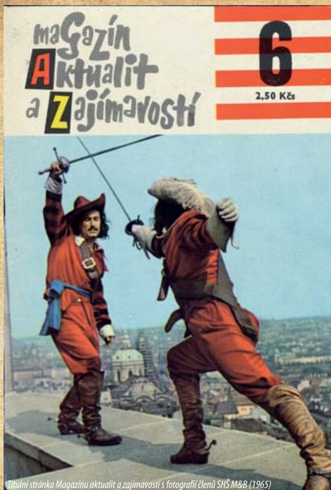
Titulní stránka Magazínu aktualit a zajímavostí s fotografií členů SHŠ M&B (1965)

Dnes musí organizátoři zpravidla vystačit jen ze vstupného, sem tam přispějí i městské části anebo vzácní sponzoři z řad místních podnikatelů. Tak zvané „bitvy“ proto působí amatérsky, jedná se o dnes již tradiční setkání mužů (a žen) ve zbrojích a kostýmech, kteří se podle tu lepšího, tu horšího scénáře snaží navodit atmosféru tu středověkého, tu novějšího boje. Nechybí